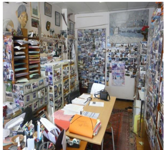
Fig. 1 Le bureau

Je ne recevrai plus ses appels téléphoniques impromptus dans lesquels j'avais toujours droit à un tonitruant : « Maury qu'est-ce que tu fais ? Passe me voir dans mon bureau, j'ai quelque chose pour toi ». Car il avait toujours une petite attention pour les membres de son équipe. Et ces moments passés ensemble étaient toujours l'occasion de partager une