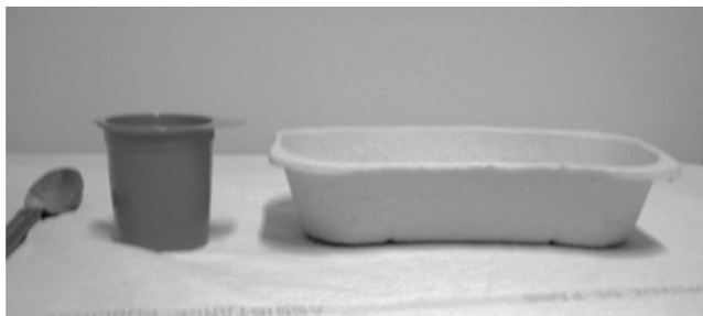
Fig. 1 Proposition d'une échelle de quantification d'une hémoptysie. Une cuiller à café correspond à moins de 5 ml de sang, un crachoir (ou petit verre de cuisine) à 120 ml de sang et un haricot à 300 ml de sang